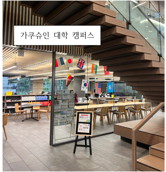
가쿠슈인 대학 캠퍼스