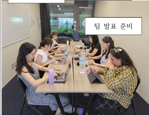
팀 발표 준비