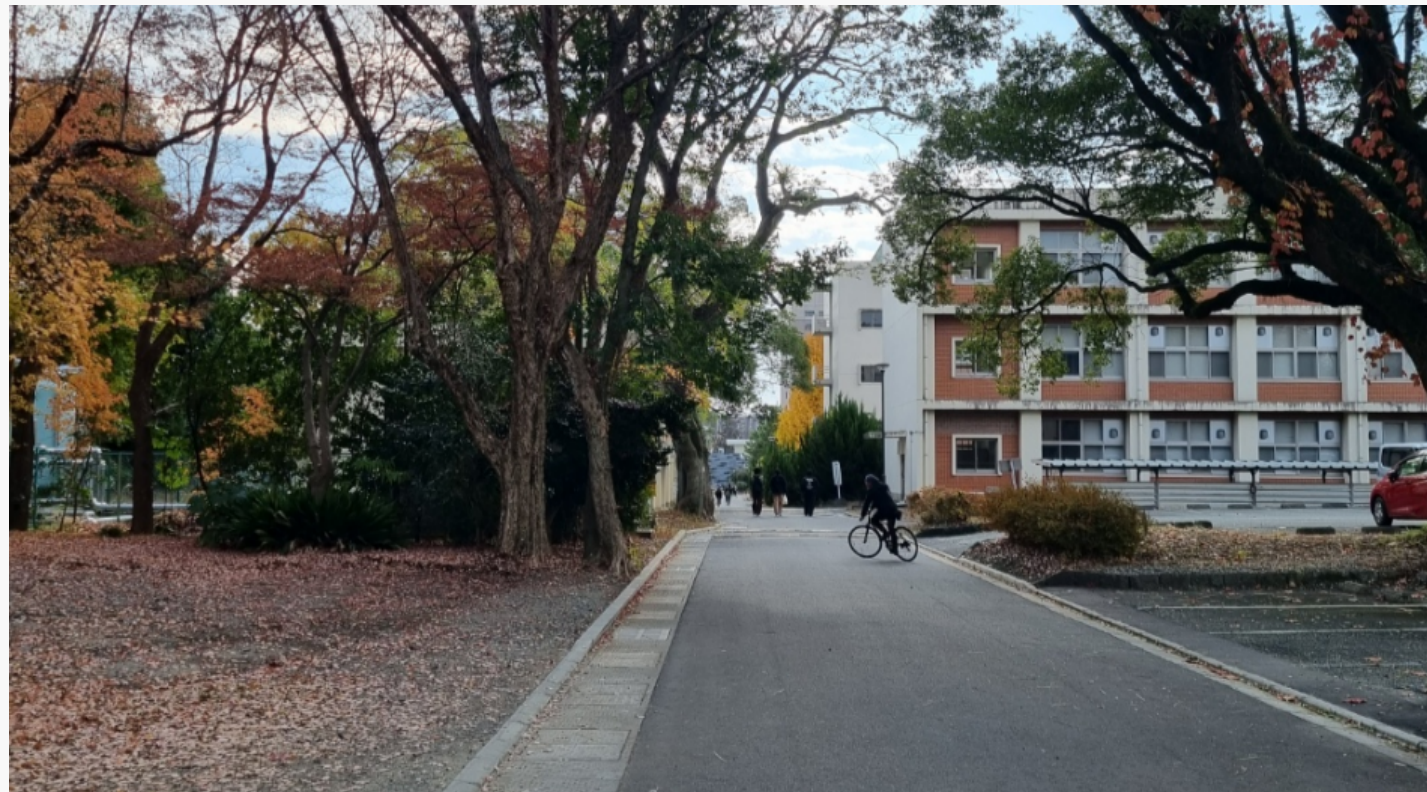
구마모토 대학교 캠퍼스