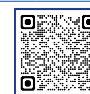
Office of International Affairs