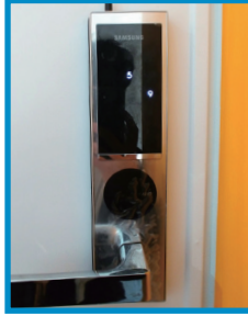
나. 화면에 나오는 2개의 숫자 하나씩 클릭