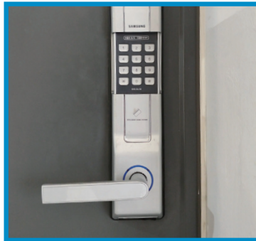
비밀번호 4자리와 * 입력